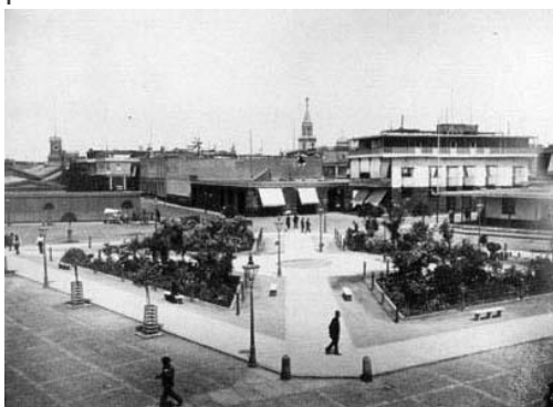
Nuevo trazo de la Plaza Grau, nótese que aún no está puesto el monumento.

Indudablemente la empresa de ferrocarril obtiene un bonito edificio de albañilería de ladrillo con techos, puertas, ventanas y pavimento, siendo todo de construcción reciente, en lugar del vetusto capuchón de madera que hoy tiene y que ahoga por decirlo así a la plaza actual.