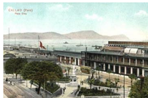
Nuevo local de la estación del Ferrocarril Ingles frente a la Plaza Grau

Ese patio tendrá entrada por la Plaza Grau y salida por la Avenida o sea por la fachada lateral.