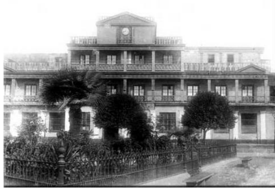
Fachada principal del Ferrocarril Ingles

En resumen, con el empleo de una casi insignificante en relación a las ventajas que se obtiene, el Callao se transforma y aparece ante los que a sus playas llegan tal como debe ser, el primer puerto de la República tanto por su glorioso pasado histórico como por su importancia comercial”